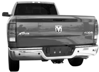
Dodge Ram Pickup

Adaptador del cableado de control eléctrico del remolque